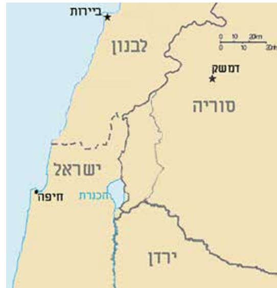
מפת גבולות ישראל סוריה ולבנון

ובאשר לטריפולי אשר מצפון לבירות - הכריזה סוריה שלא תשקוט עד שתקבל את נמל טראבלוס. עתה אין מדברים על כך, אלא על אלכסנדריה. זהו סג'ק המונה קרוב למאתיים עשרים אלף נפש, שמהם 40% תורכים, 10%